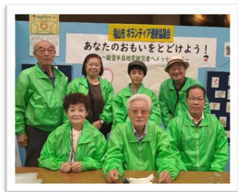
↑福山市ボランティア連絡協議会 役員のみなさん