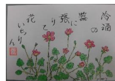
↑ヒメフウロウソウ