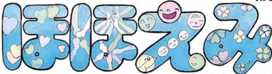
題字デザインは松岡恵子さん