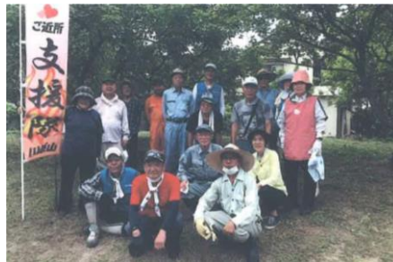
杏子畑の除草作業