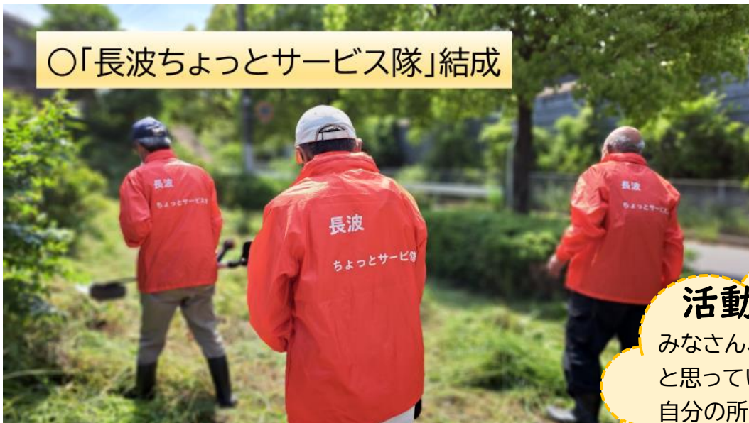
○「長波ちょっとサービス隊」結成