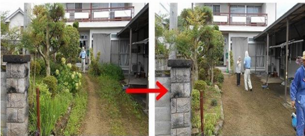
庭の周り草取りの依頼