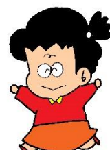
社協イメージキャラクター ふれあいマーちゃん