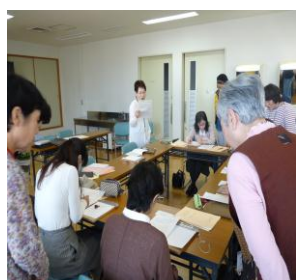
↑ みなさん真剣に点字を打っていきます