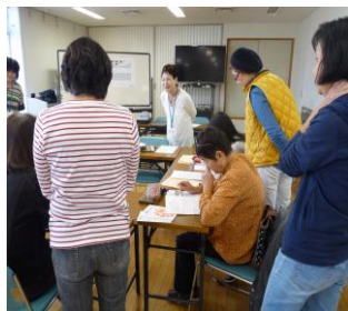
↑ 笑顔が見られ、和やかな雰囲気を受講中