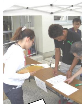
ボランティア依頼を受付