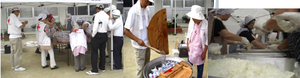
赤十字社広島県支部福山市地区

それぞれができることは何か、地域でできることは何か、そのために社協ができることは何かを今まで以上に考えていく必要があると感じました。