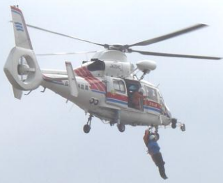
東日本大震災 パネル展示

9月1日（土）、芦田川河川敷・光小学校で総合防災訓練を行いました。光小学校では災害ボランティアセンターを立ち上げ、避難所からのボランティア依頼に対応し、避難所へボランティアを派遣する訓練を行いました。