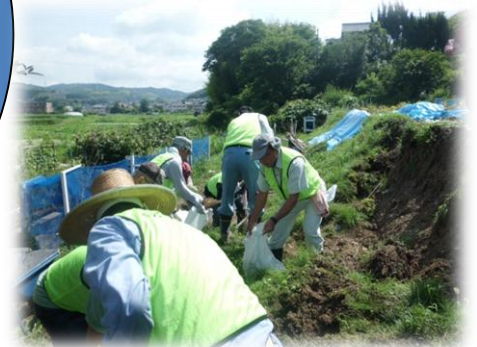
福山市大雨災害支援活動