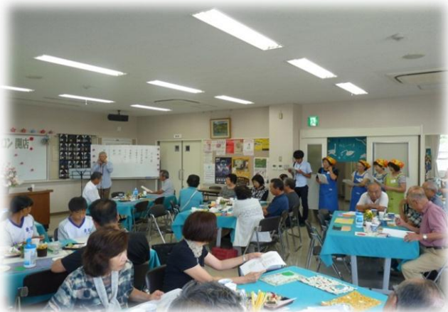
坪生学区おしゃべりサロン