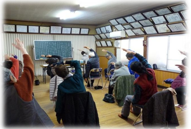
西学区 おい 老な一ず